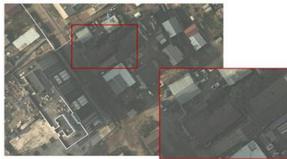
Şəkil 5: Atmosfer faktoru olan dumanın aerofototəsvirin dekodlaşdırma keyfiyyətinə təsirinin nümunəsi

Bu amillərin təsiri görüntü keyfiyyətinin aşağı düşməsinə səbəb ola bilər. Aşağıda sadalanan amillərin təsiri nəticəsində aerofototəsvirlərin keyfiyyət probleminə aid nümunə verilmişdir (Şəkil 3).