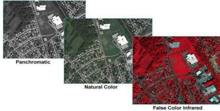
Şəkil 4: Aeropyonkaların növləri

Aeropyonkalar. Sabit imitasiya bazası üzərinə qoyulmuş çox qatlı emulsiyadır. Ümumiyyətlə aeropyonkalar eni təxminən 10 düym və uzunluğu 200 ilə 500 fut arasında olan rulonlarda mövcuddur. Müxtəlif məqsəd və unikal vəziyyətlərə uyğunluğundan asılı olaraq istifadə olunan müxtəlif aeropyonkaların növləri mövcuddur. Panxromatik və təbii rəngli plynkalar ən çox istifadə olunandır. Bu iki plynka və infraqırmızı birlikdə aerofotoqrafiyada istifadə olunan əsas bazanı təşkil edir (Şəkil 4).