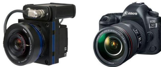
Şəkil 3: Trimble şirkətinə məxsus AIC rəqəmsal fotokamera

Hal-hazırda aerofotoçəkiliş kameraları ümumiyyətlə rəqəmsaldır. Hal-hazırda rəqəmsal fotoqrammetriyada tamamilə rəqəmsal kamera sistemlərinin istifadəsinə keçilmişdir. Müasir rəqəmsal kameralar tərəfindən həyata keçirilən rəqəmsal fotoqrammetriya əhəmiyyətli dərəcədə yüksək performans, daha yüksək metrik dəqiqlik, həm panxromatik, həm də çoxkanallı (R, G, B, yüksək keyfiyyətli) görüntülər əldə etməyə imkan verir (Şəkil 3).