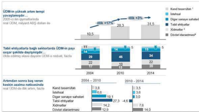
Şəkil 4. Sektorlar üzrə iqtisadi artım

2004-2011-ci illər ərzində Azərbaycan Respublikasında ÜDM istehsalı 3 dəfə, sənaye məhsulunun istehsalı 2,7 dəfə, kənd təsərrüfatında məhsul istehsalı 1,3 dəfə, tikinti sektorunda görülən işlərin həcmi 3,2 dəfə, rabitə və informasiya sahəsində 6,4 dəfə, əməkhaqqı 4,7 dəfə, xarici ticarət dövriyyəsi 7 dəfə, idxal 3,7 dəfə, ixrac isə 10,3 dəfə artmışdır. 2007-2010-cu illər ərzində kənd təsərrüfatı məhsullarının istehsalçılara əkin sahəsinin və çoxillik əkmələrin becərilməsində sərf olunan yanacaq və motor yağlarına, habelə buğda və çəltik səpininə görə dövlət büdcəsinin vəsaiti hesabına 307,5 milyon manat məbləğində subsidiya verilmişdir.